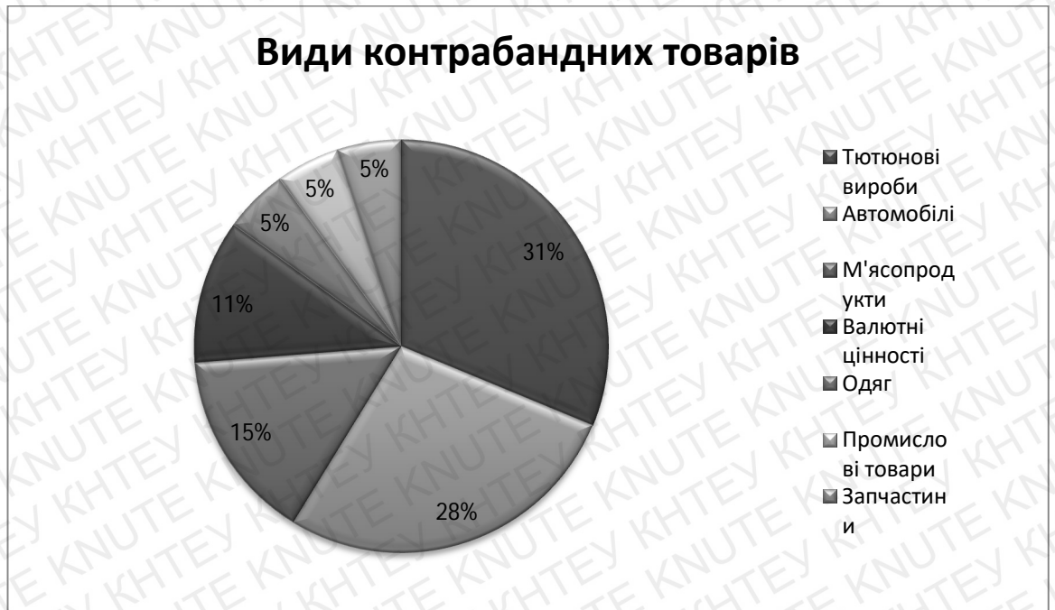
Рис. 3.3. Основні види контрабандних товарів та вантажів

Аналіз нормативно-правових та наукових джерел дає підстави стверджувати, що контрабанду слід вважати однією з реальних загроз національній безпеці України. Цей висновок обумовлений ступенем небезпеки злочинів, передбачених статтями 201 та 305 Кримінального кодексу України.