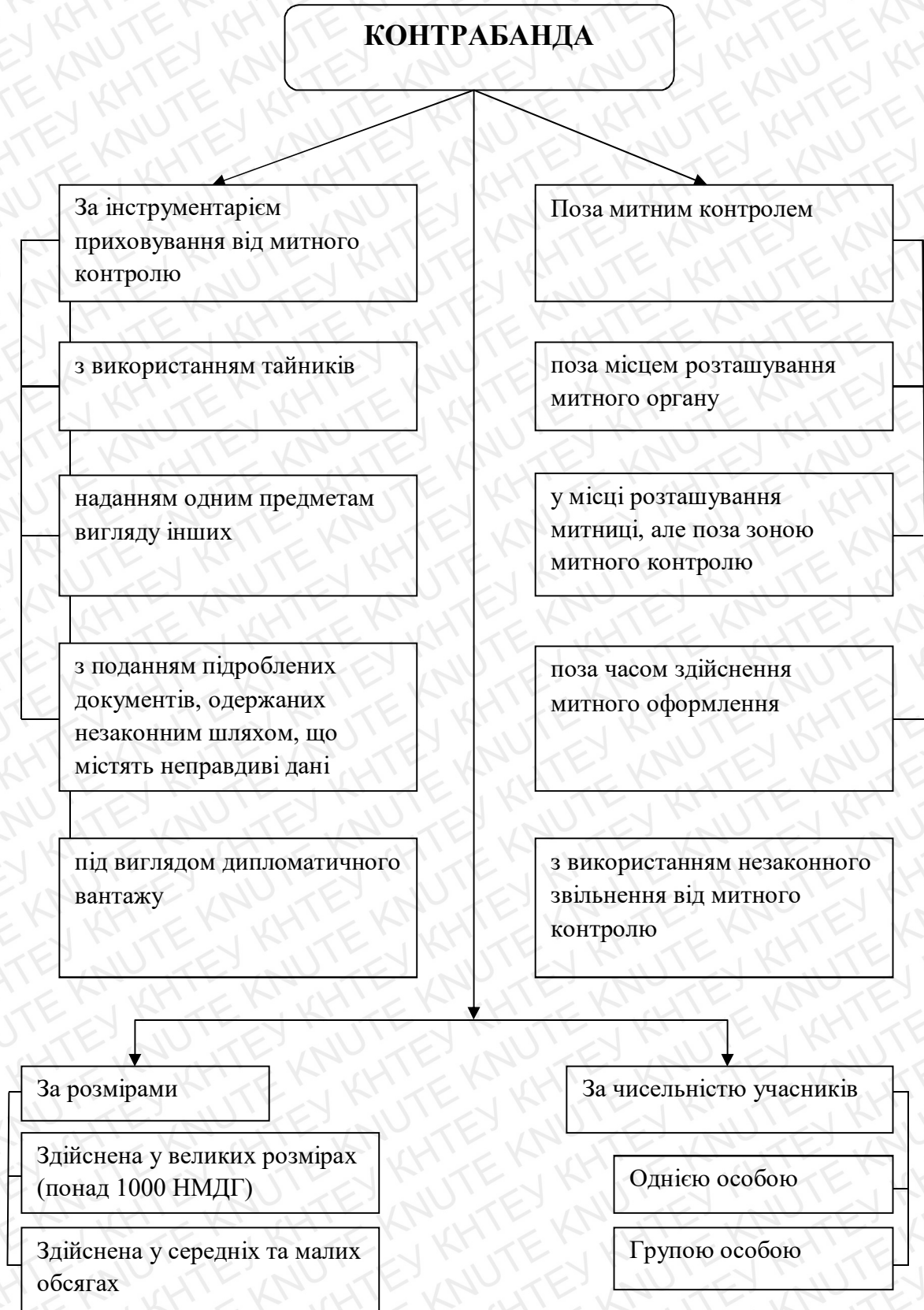
Рис. 3.1. Типологія поняття «контрабанда» з врахуванням особливостей дій її здійснення