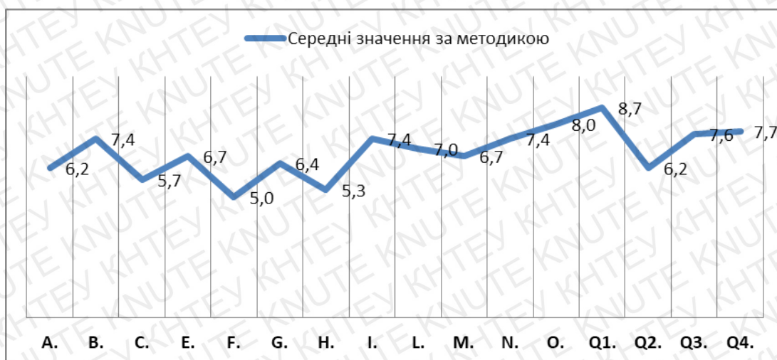
Рис.3.1.1. Зведені результати отриманих даних серед студентів за методикою 16-факторного опитувальника Р. Кеттела

Екстернальний тип контролю характеризується як адаптивно-конформний тип відповідальної поведінки. В основі даного типу лежить внутрішня ідентифікація з певною соціальною групою. Але в даному випадку особиста відповідальність зводиться до мінімуму. Люди з інтернальним локусом контролю, навпаки, вважають, що саме власними вчинками керують події в житті, частіше відчувають відповідальність за результати своєї діяльності, покладаються на особисті цінності і уявлення.