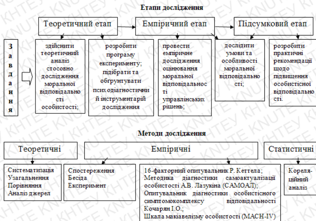
Рис. 2.1.1. Емпірична модель дослідження психологічних особливостей оцінювання моральної відповідальності за прийняте управлінське рішення