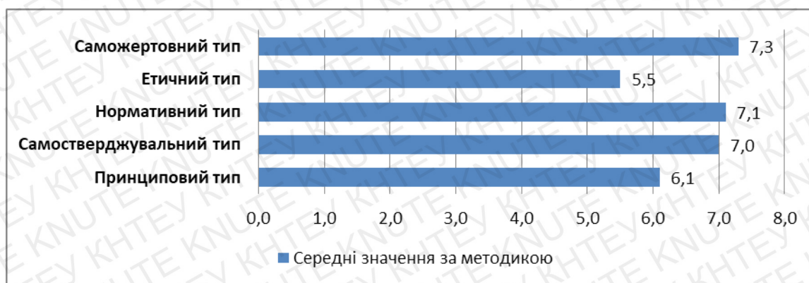
Рис. 3.1.3. Зведені результати отриманих даних за методикою «Опитувальник діагностики особистісного симптомокомплексу відповідальності Кочарян І.О.»

Також у дослідженні було застосовано опитувальник діагностики особистісного симптомокомплексу відповідальності Кочарян І.О. , який спрямовано на діагностику переважаючих типологічних варіантів відповідальної поведінки особистості. Опитувальник складається з 67 питань, які відповідають 5 типам відповідальної особистості. Питання відображають когнітивну, поведінкову, а також емоційну складову. Отримані результати дослідження представлено у вигляді гістограми на рисунку 3.1.3.