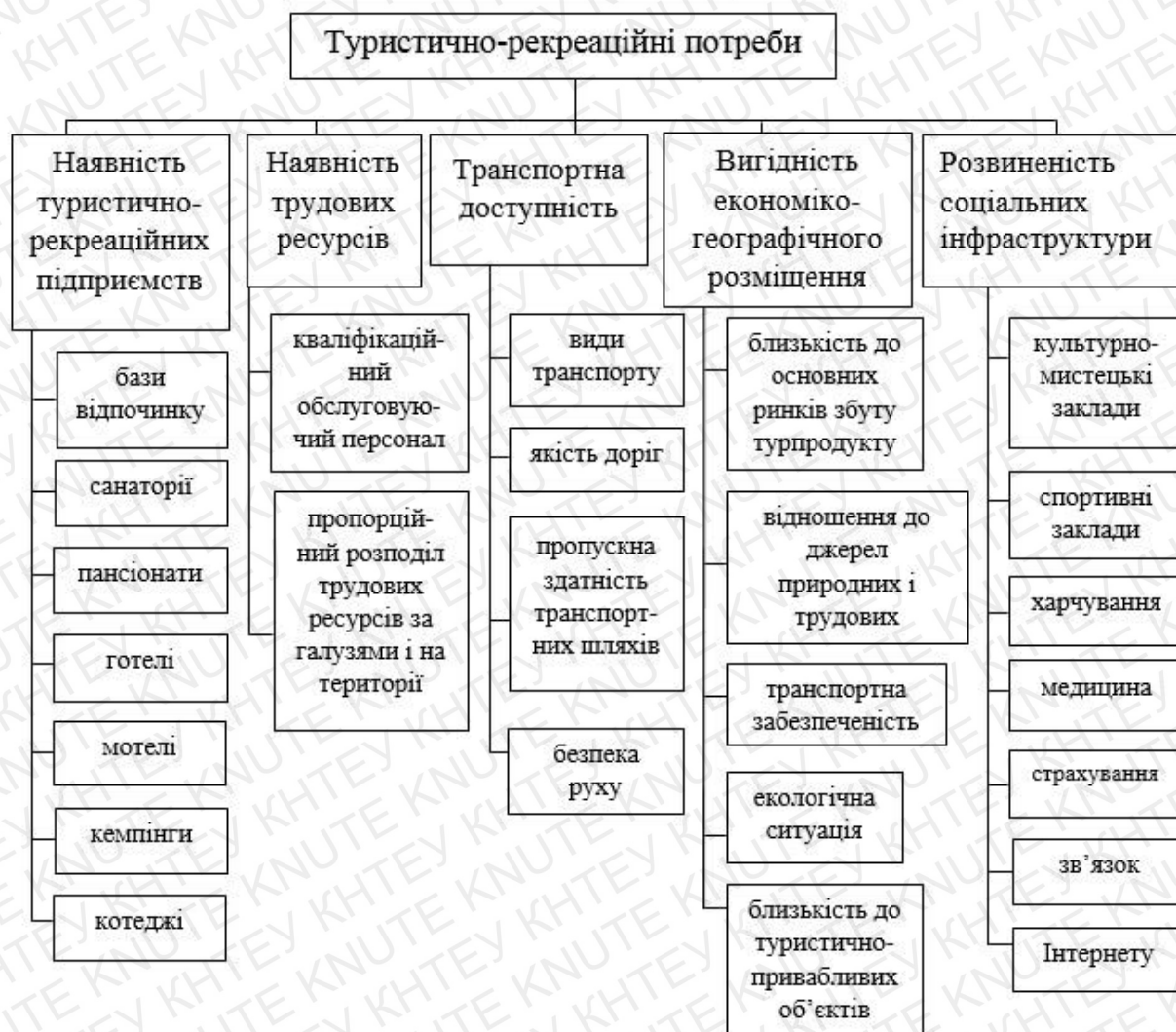
Рис. 1.2. Туристично-рекреаційні потреби [28].

аспектів, культурно-соціальних закладів на території туристично-реакційного комплексу (рис. 1.2).