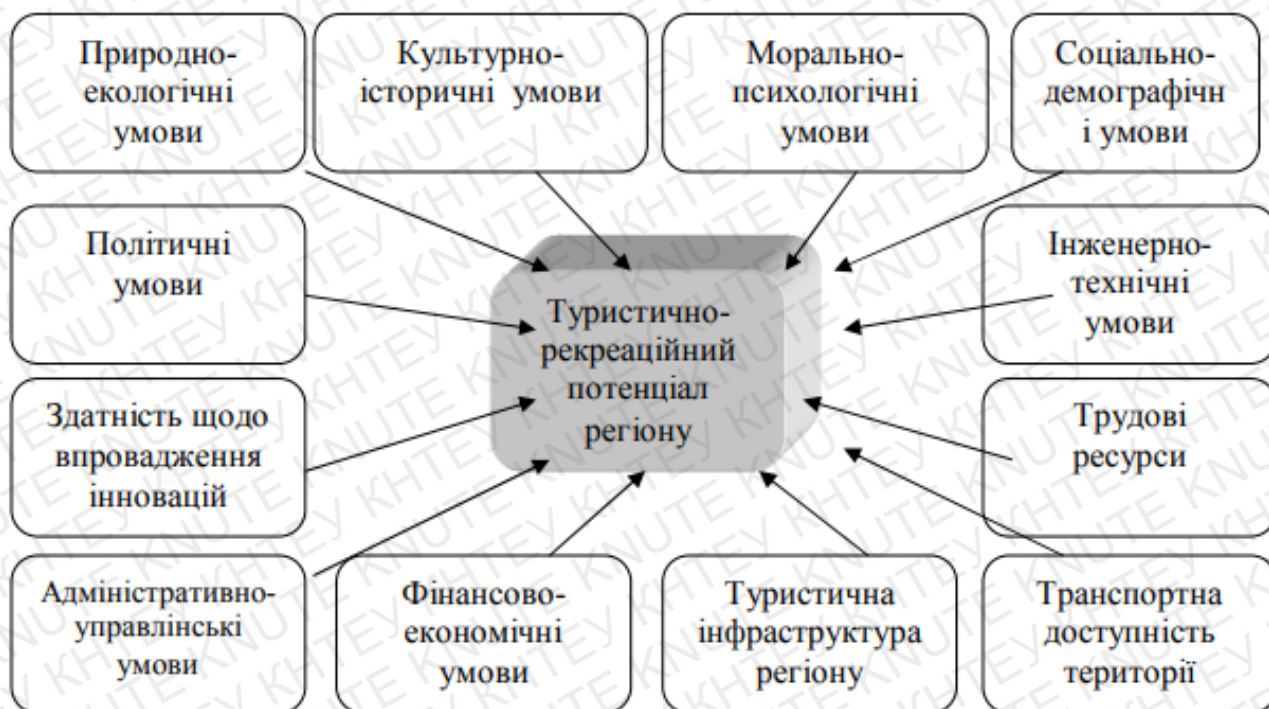
Рис. 1.1. Детермінанти туристично-рекреаційного потенціалу окремої території [17].

У своїй монографії В. Герасименко розглядає дефініції науковців XX та XXI століття. Уніфікувавши всі визначення автор виділив низку складових туристично-рекреаційного потенціалу, яку ми вважаємо актуальною та ємною на сьогодні (рис. 1.1)