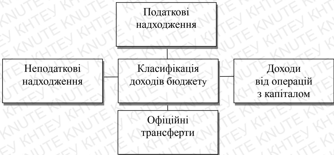
Рис. 1.2. Класифікація доходів бюджету [41]

Доходи бюджету за методом залучення коштів класифікуються та такими розділами [40]: 1) податкові надходження; 2) неподаткові надходження; 3) доходи від операцій з капіталом; 4) офіційні трансферти.