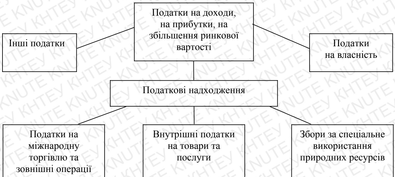
Рис. 1.3. Бюджетна класифікація податкових надходжень [41]

Загальнодержавні податки і збори та місцеві податки і збори, тобто обов'язкові платежі є джерелом наповнення доходів бюджетів різних рівнів. Згідно з розділом 1 Бюджетної класифікації «Класифікація доходів бюджету» їх систематизують за такими групами податкових надходжень (рис. 1.3).