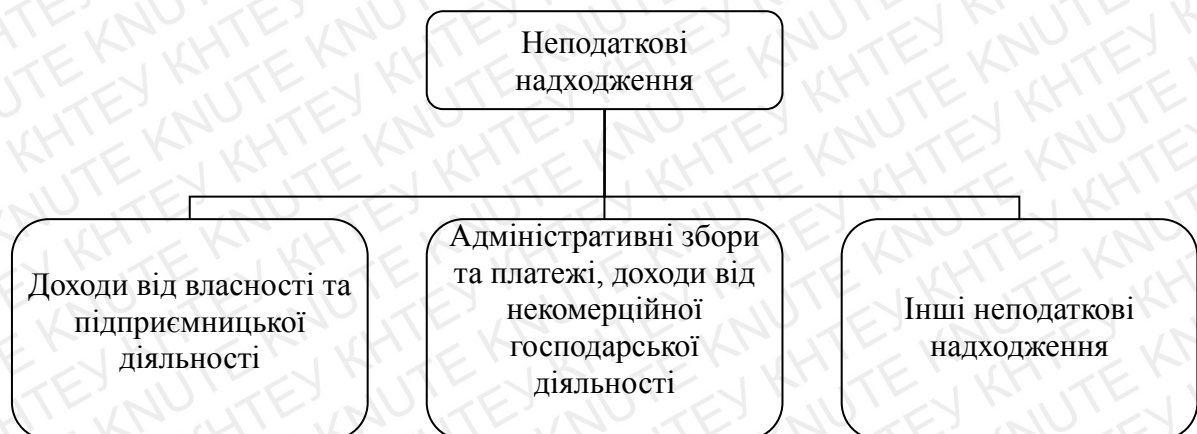
Рис. 2.1. Класифікація неподаткових надходжень [41]

Неподаткові надходження – доходи, які держава отримує від власності, підприємницької діяльності, фінансових санкцій та інших доходів, що не належать до обов'язкових податків, зборів і платежів.