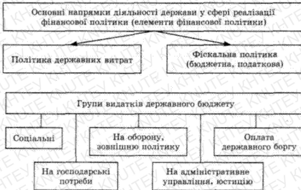
Рис. А.1 Місце бюджету у фінансовій системі