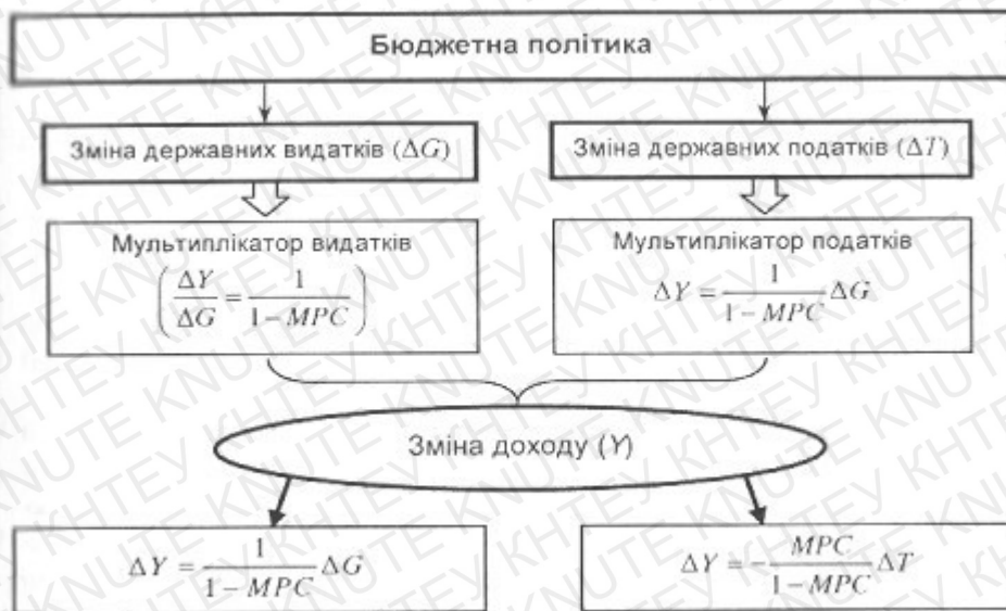
Рис. В.1. Дія мультиплікаторів бюджетної політики згідно з кейнсіанською теорією