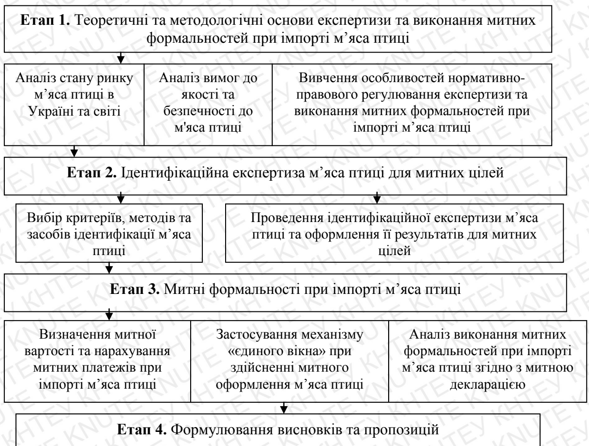
Рис. 2.1. Загальна схема досліджень м'яса птиці

Об'єктом дослідження було обрано м'ясо птиці, що імпортується на митну територію України згідно з МД UA №205090/2018/108032. Для дослідження було обрано м'ясо птиці заморожене: частини тушок, необвалені (грудинки), без вмісту солі та перцю, а також без додаткової кулінарної обробки. Відповідно до вищезазначеної інформації предметом дослідження є показники властивостей та характеристики якості м'яса птиці, що дають змогу ідентифікувати його код згідно з УКТЗЕД та встановити митну вартість.