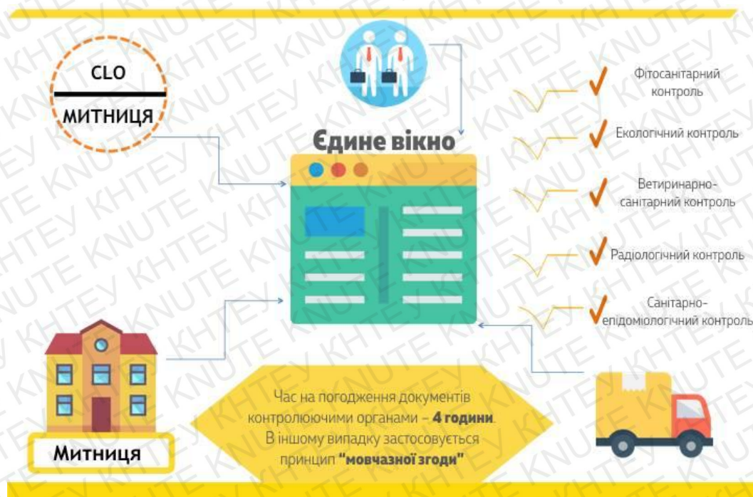
Рис. 3.1. Застосування механізму «єдиного вікна» при імпорті м'яса птиці

Механізм «єдиного вікна», який застосовується при імпорті м'яса птиці наведено на рис. 3.1.