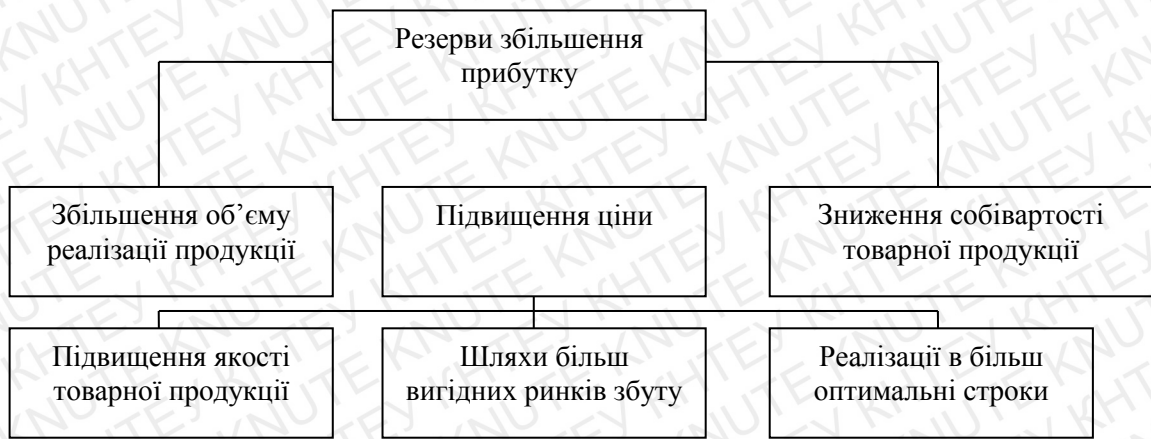
Рис. 3.1 Основні напрями пошуку резервів збільшення прибутку від операційної діяльності

Підприємство своєчасно отримує оплату за реалізовану продукцію, товари, надані послуги і виконані роботи від покупців та замовників. Крім того, витрати на надані послуги та реалізацію значно менші, ніж отримані доходи, і підприємство отримує прибуток від операційної діяльності.