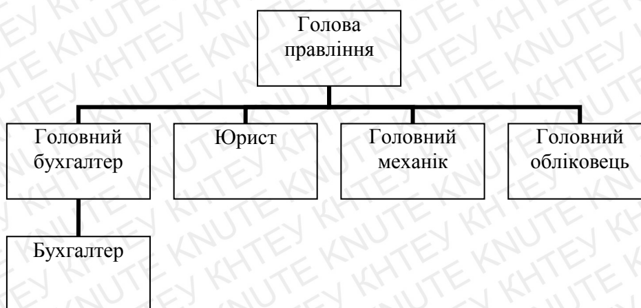
Рис 1.1 Організаційна структура ТОВ «ПРАДОСЕРВІС»

відповідальністю «ПРАДОСЕРВІС» повинен вирішувати будь-які як стратегічні, так і поточні питання діяльності підпорядкованих йому працівників.