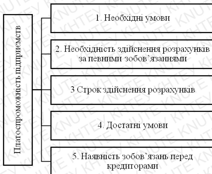
Рис.1.1. Основні змістовні складові поняття «платоспроможність»