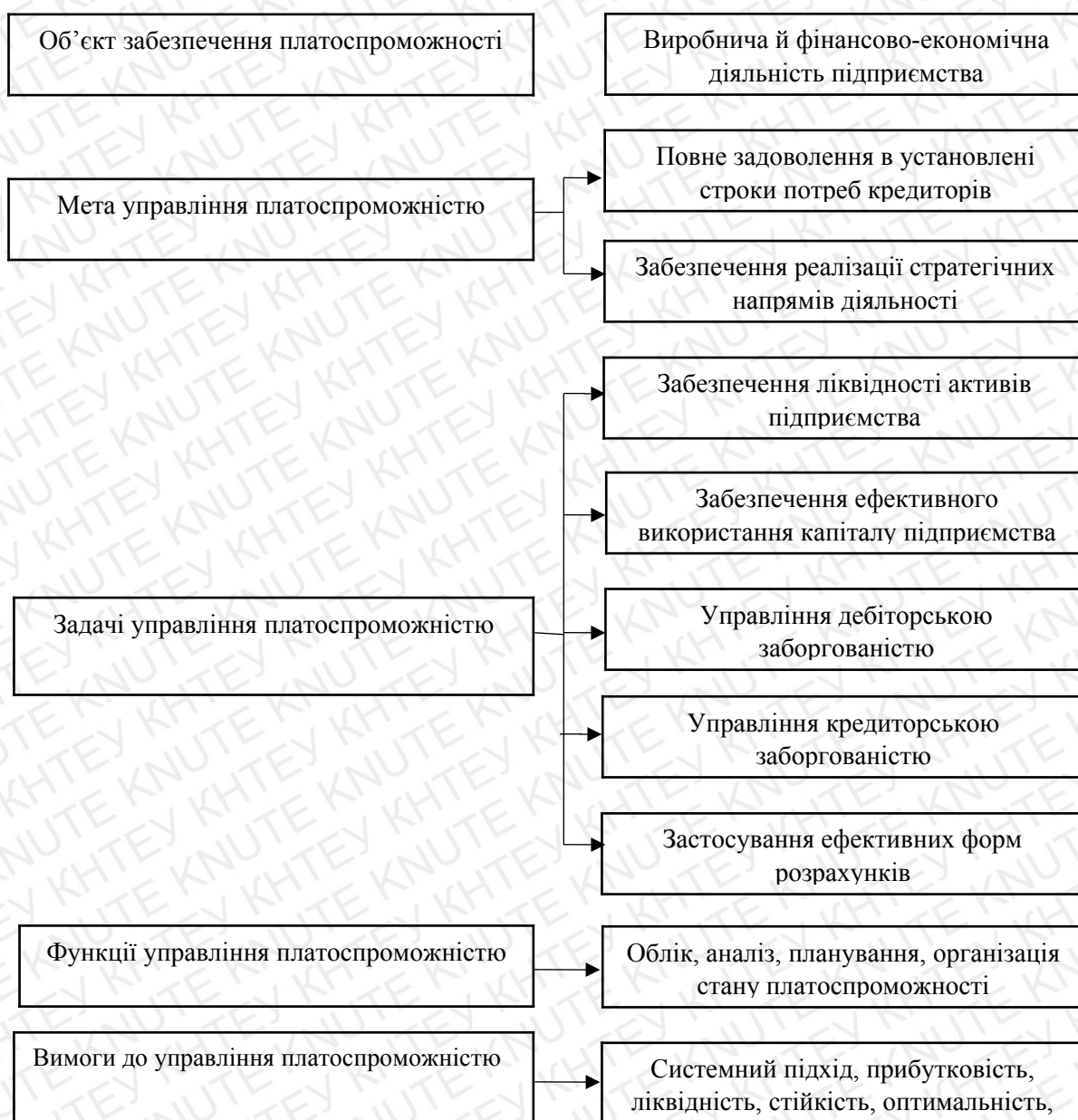
Рис. 1.3. Концептуальні засади забезпечення платоспроможності підприємства [33, с. 191]

Концептуальні засади забезпечення платоспроможності підприємства наведено на рис.1.3.