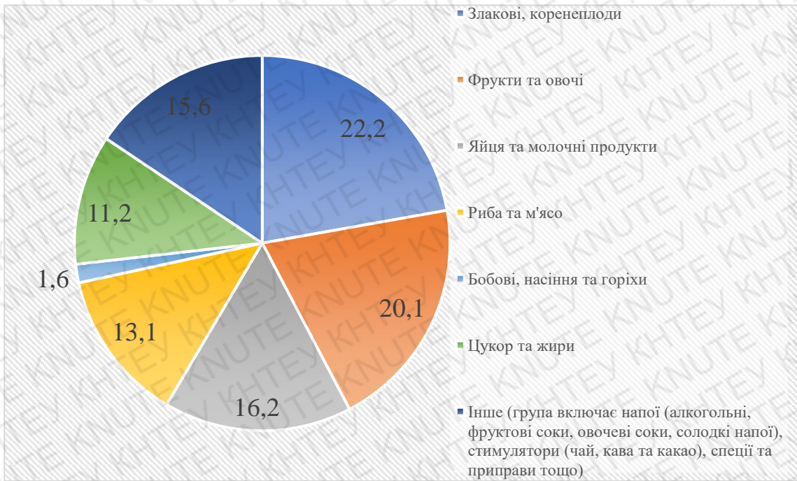
Рис. 2.1 Частка в раціоні різних видів продуктів харчування (г/на людину/на день), % (країни з високим рівнем доходів)