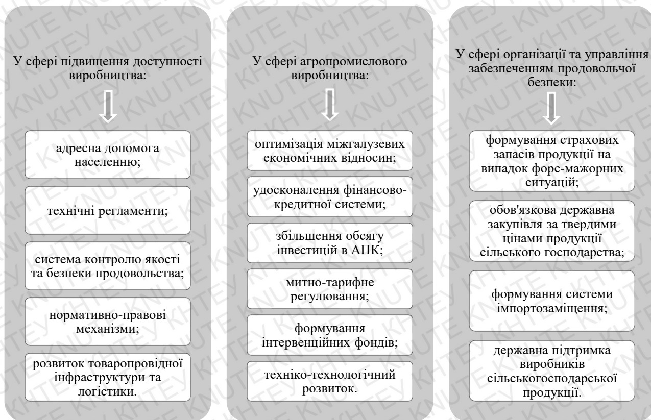
Рис. 3.1 Основні способи забезпечення продовольчої безпеки на національному рівні

Для забезпечення продовольчої безпеки країни використовують різні засоби. Основними шляхами забезпечення продовольчої безпеки на національному рівні є (рис. 3.1):