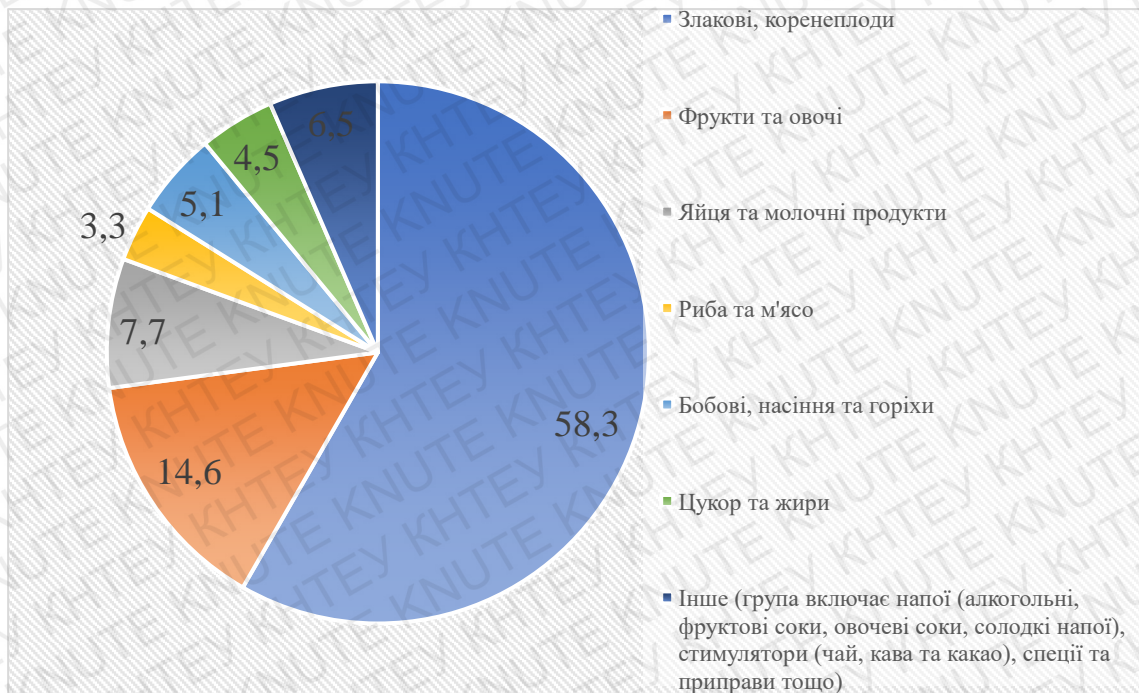
Рис. 2.2 Частка в раціоні різних видів продуктів харчування (г/на людину/на день), % (країни з низьким рівнем доходів)