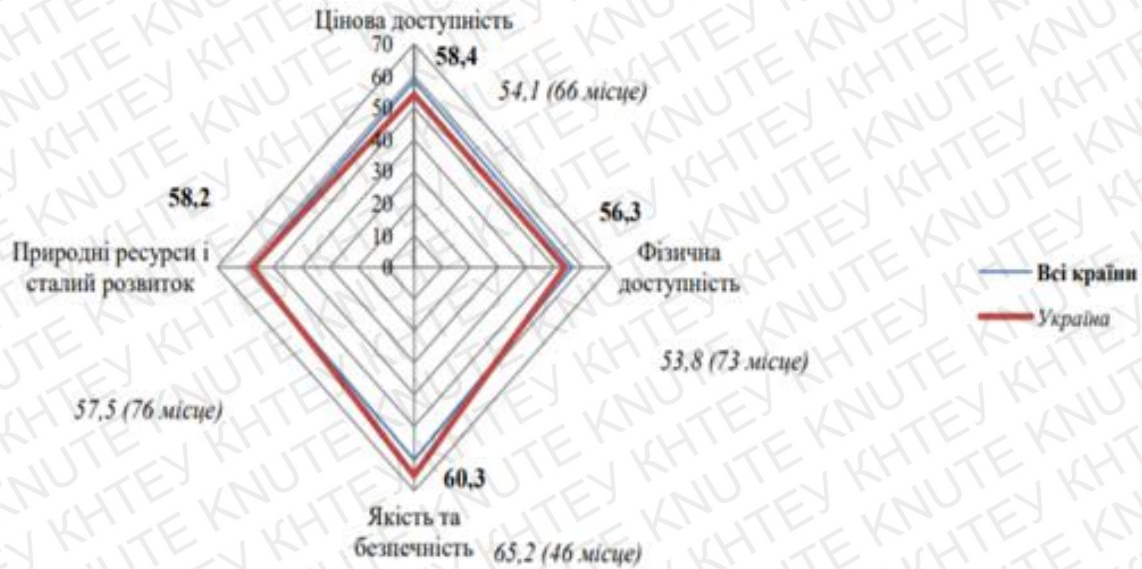
Рис. 2.2 Порівняльний аналіз значень субіндексів продовольчої безпеки України з середніми світовими значеннями в 2018 році [32]

значення; за природними ресурсами і сталим розвитком – 57,5 балів (76 місце), що на 0,7 нижче за середньосвітове значення [31].