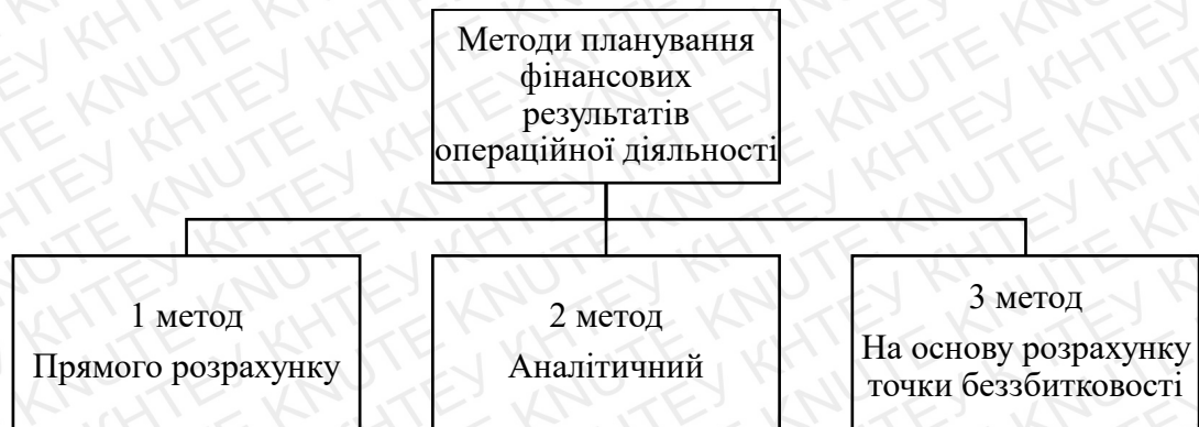
Рис. 1.1 Методи планування фінансових результатів операційної діяльності[27,31,33].

виробничими потужностями, саме вони і є відправною точкою планування. Після визначення обсягу продажу розробляється виробнича програма на основі укладених контрактів [33].