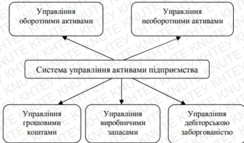
Рис. 1.1. Структурна система управління активами підприємства [7, с.227]

що сформоване з двох основних блоків – управління оборотними та необоротними активами.