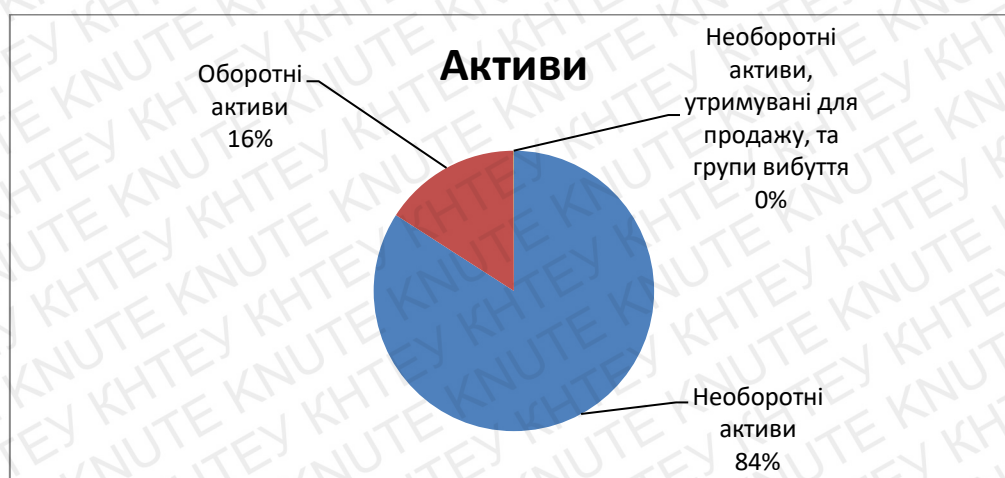
Рис.2.1. Структура активів підприємства ДП «НАЕК «Енергоатом» за 2017-2019 роки

Доцільно відобразити дані результати графічно на рисунку 2.1.