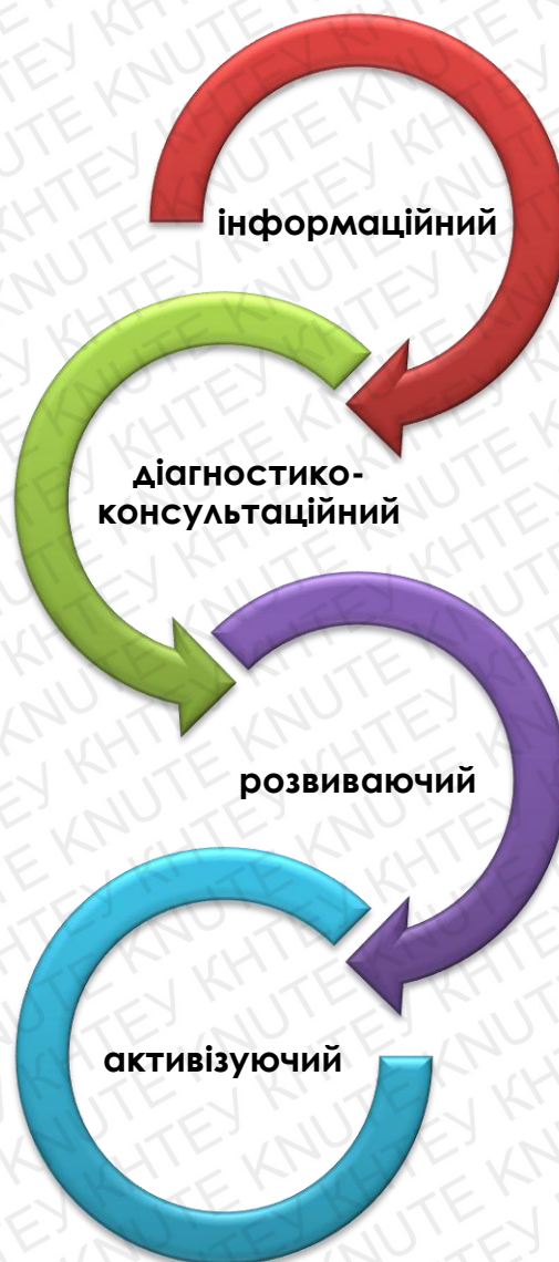
Рис.3.1Схема етапів профорієнтаційної роботи у КНТЕУ [авторська розробка]

У процесі дослідження профорієнтаційної роботи у Київському національному торговельно-економічному університеті нами було виділено в ній чотири етапи: інформаційний, діагностико-консультаційний, розвиваючий, активізуючий.