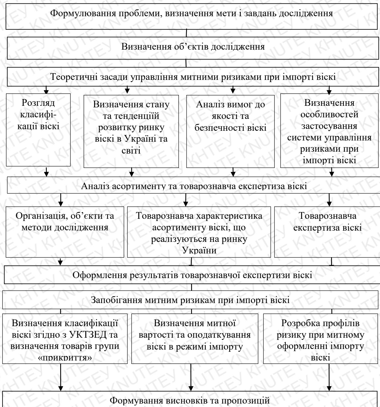
Рис. 2.1. Етапи проведення досліджень

Етапи виконання дослідження схематично можна подати в наступній послідовності (рис. 2.1).