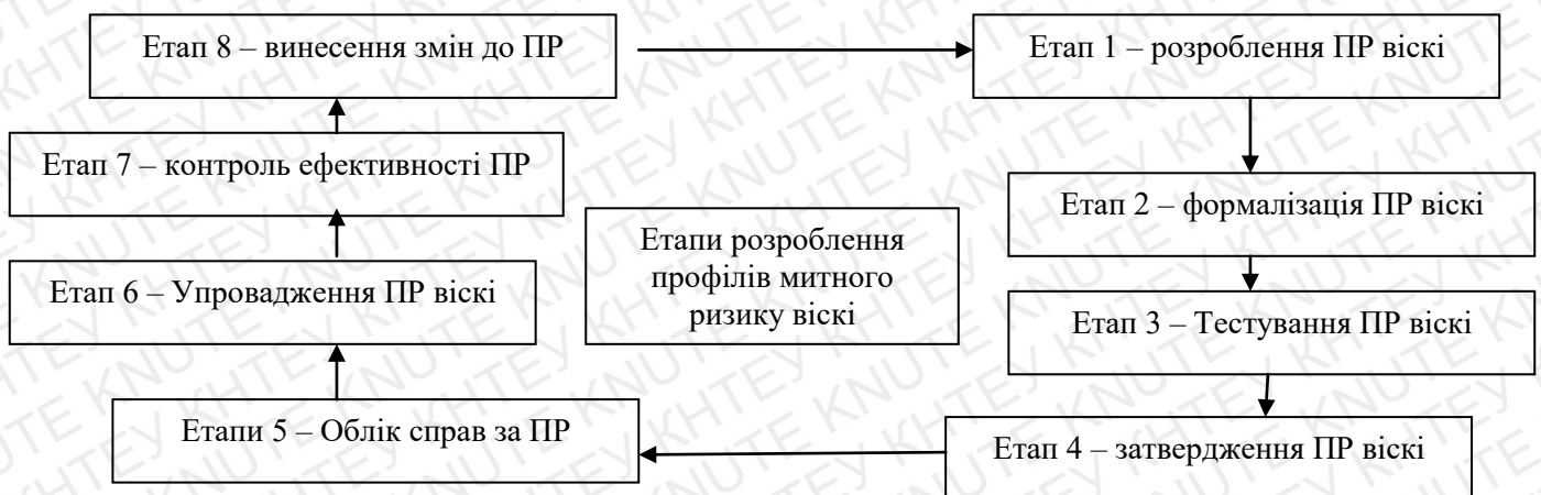
Рис. 3.1. Етапи розроблення профілів митного ризику [39]

В основі будь-якої системи управління ризиками покладено процес їх профілювання. В теорії ризиків, профіль ризику – це залежність зміни економічного показника від зміни впливу чинника. Вітчизняним нормативним полем регламентовано порядок розробки, формалізації, тестування та затвердження профілів ризику (рис. 3.1).