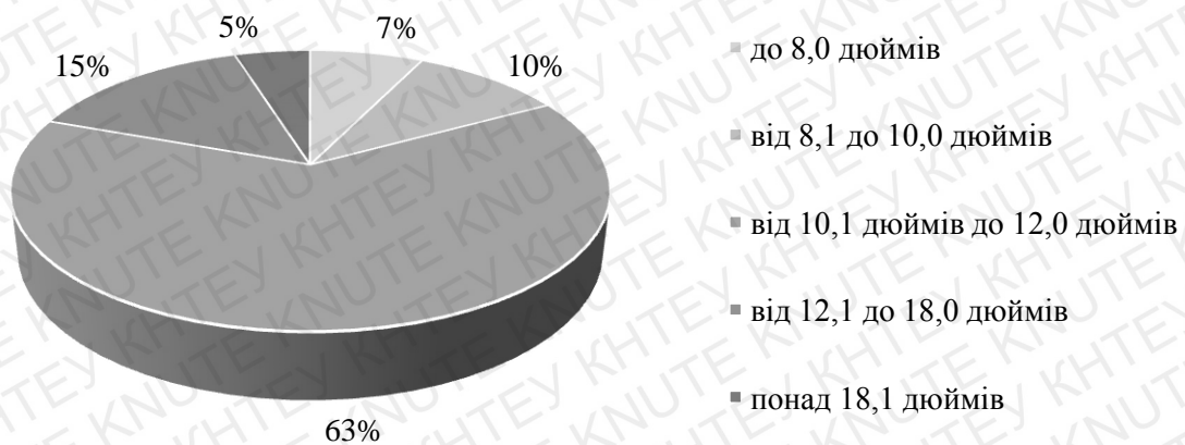
Рис. 2.1 Асортимент гіроскутерів в Україні за розміром колеса

Розмір колеса обумовлює здатність пересування покриттям різного типу. Найбільш вживаною та широкозастосованою групою є гіроскутери з розміром колеса від 10,1 дюймів до 12,0 дюймів. На рисунку 2.1 наведений асортимент гіроскутерів, що реалізуються на ринку України, за розміром колеса у відсотковому співвідношенні.