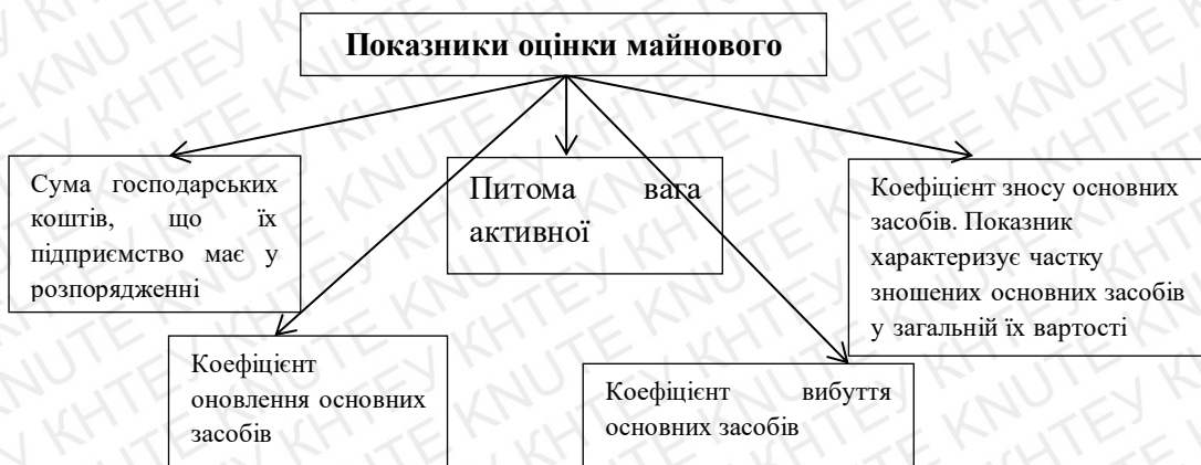
Рис. 1.1 Показники оцінки майнового стану [41, с.630]

На рисунку 1.1 зображено показники оцінки майнового стану: