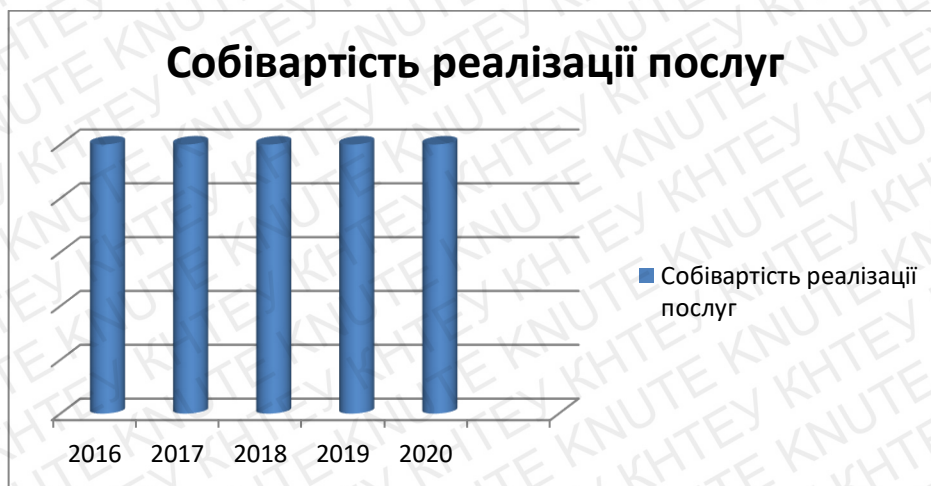
Рис. 1.4 Динаміка собівартості за 2016-2020 рр.

Собівартість реалізованих послуг підприємства ТОВ «Бейкер Тіллі Бухгалтерські послуги» зображена на рисунку 1.4.