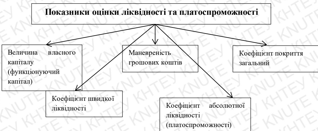
Рис. 1.2 Показники оцінки ліквідності та платоспроможності [60, с.576]

На рисунку 1.2 зображено перелік показників оцінки ліквідності та платоспроможності: