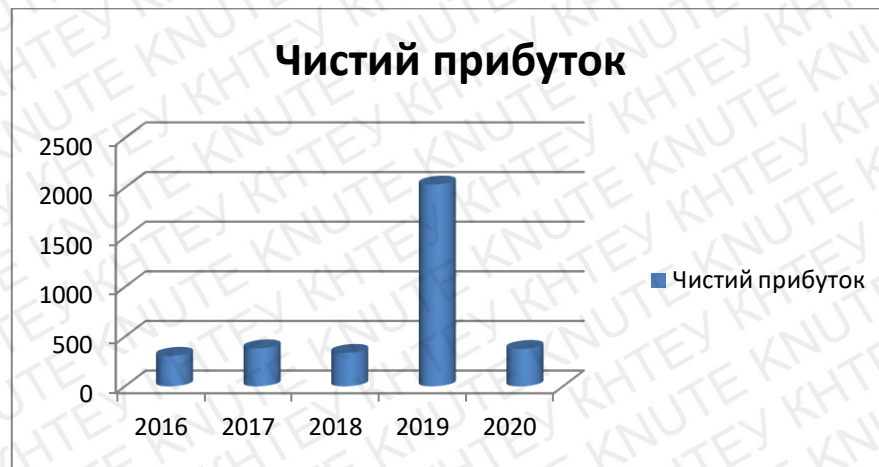
Рис. 1.5 Динаміка чистого прибутку за 2016-2020 рр.

Чистий прибуток – один з найважливіших показників фінансово-господарської діяльності підприємства. На рисунку 1.5 зображено його динаміку протягом останніх років (2016-2020 рр.).