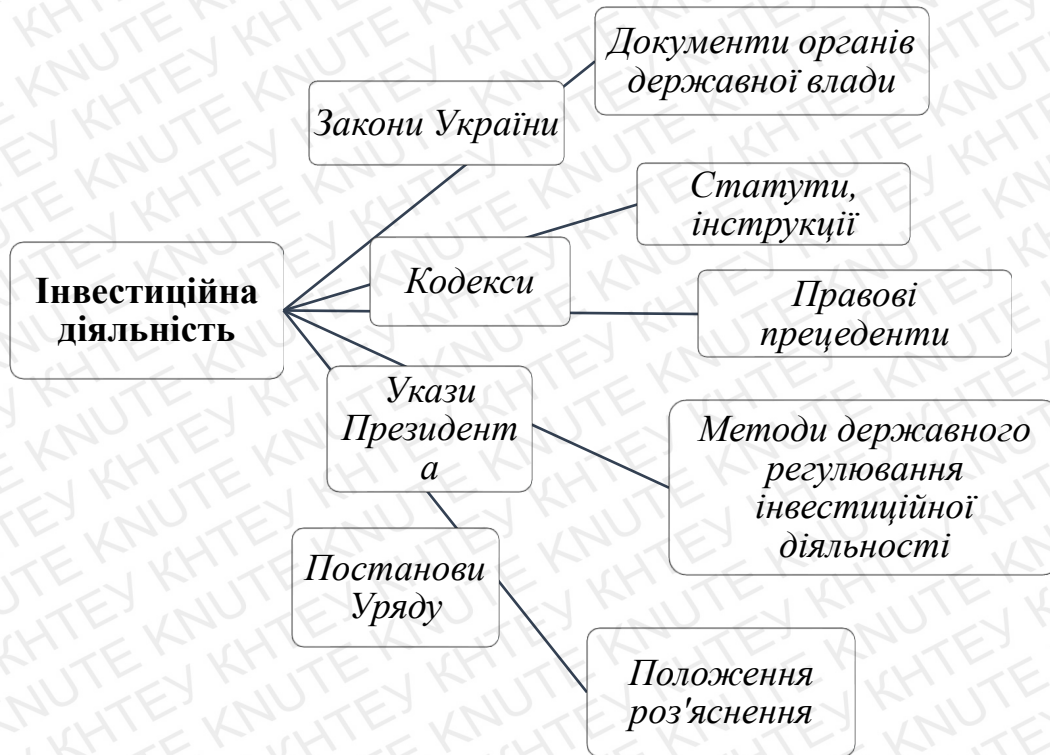
Рис. 2 Нормативно-правові акти регулювання інвестиційної діяльності. (Складено на основі аналізу законодавства).

Відповідно до ст. 8 Конституції в Україні визнається та діє принцип верховенства права. Конституція має найвищу юридичну силу. Закони і інші нормативно-правові акти повинні їй відповідати [30].