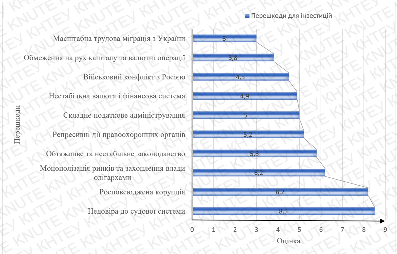
Рис. А.1. Фактори що впливають на інвестиційний клімат в Україні.

П'яте щорічне опитування інвесторів щодо факторів, які є найбільшими перешкодами для покращення інвестиційного клімату в Україні.