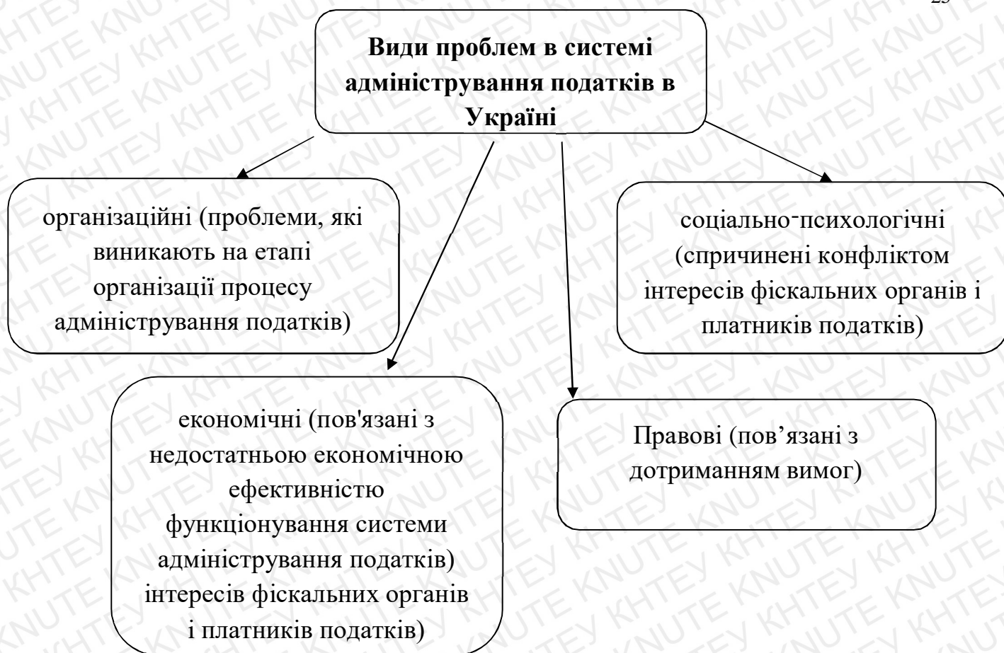
Рис 2.1. – Види проблем в системі адміністрування податків в Україні