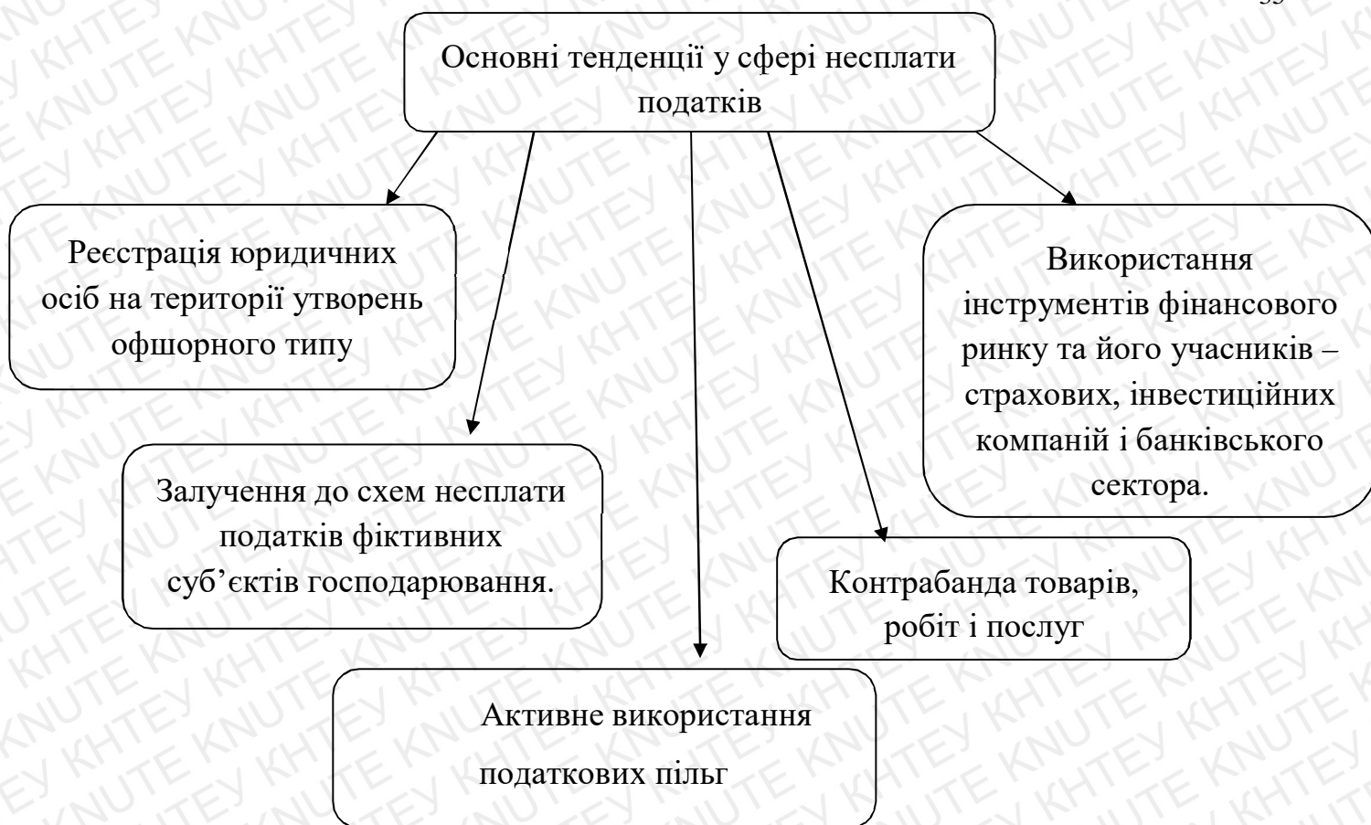
Рис. 2.2. - Основні тенденції у сфері несплати податків

Аналогічне право поширене на вітчизняні підприємства. Якщо за результатами звітного кварталу в платника податку на прибуток виникає від'ємне значення об'єкта оподаткування, то дозволяється зменшити об'єкт оподаткування наступного звітного кварталу, а також кожного з наступних двадцяти податкових періодів до повного погашення такого від'ємного значення.