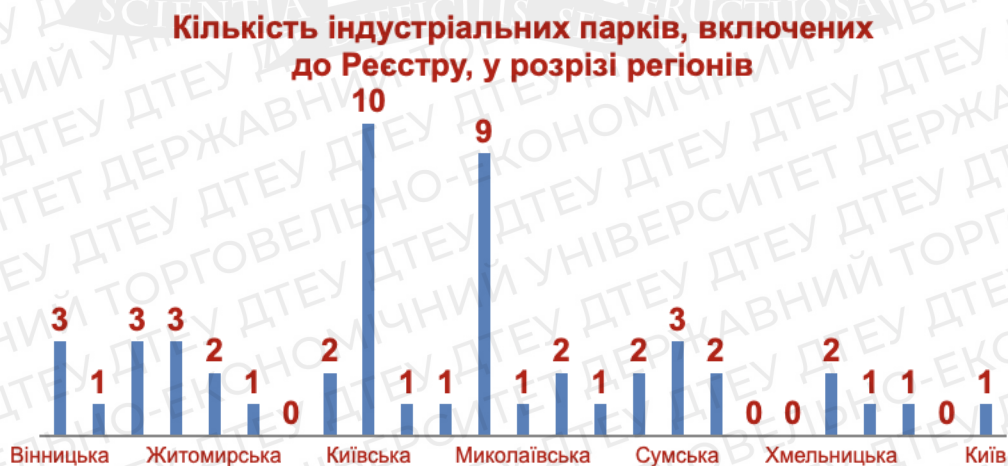
Рис.1.2.2 Кількість індустріальних парків, включених до Реєстру, у розрізі регіонів. [5]

В Україні також функціонують індустріальні парки, які не включені до Реєстру індустріальних парків Рис.1.2.2