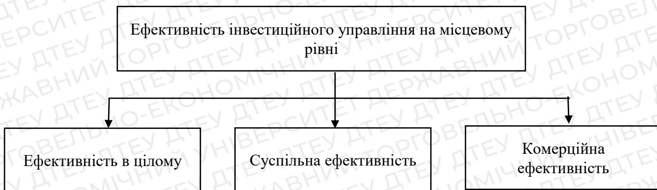
Рис. 1.1 Структура ефективності управління інвестиційними процесами на місцевому рівні

Ефективність інвестиційного управління на місцевому рівні в цілому може розглядатися з позиції народного господарства (і тоді оцінюється загальна ефективність) і з позиції абстрактного інвестора (в цьому випадку розраховується комерційна ефективність). Таким чином, визначення ефективності інвестиційного проєкту є комплексним поняття і має у своєму складі декілька елементів (рис. 1.1).