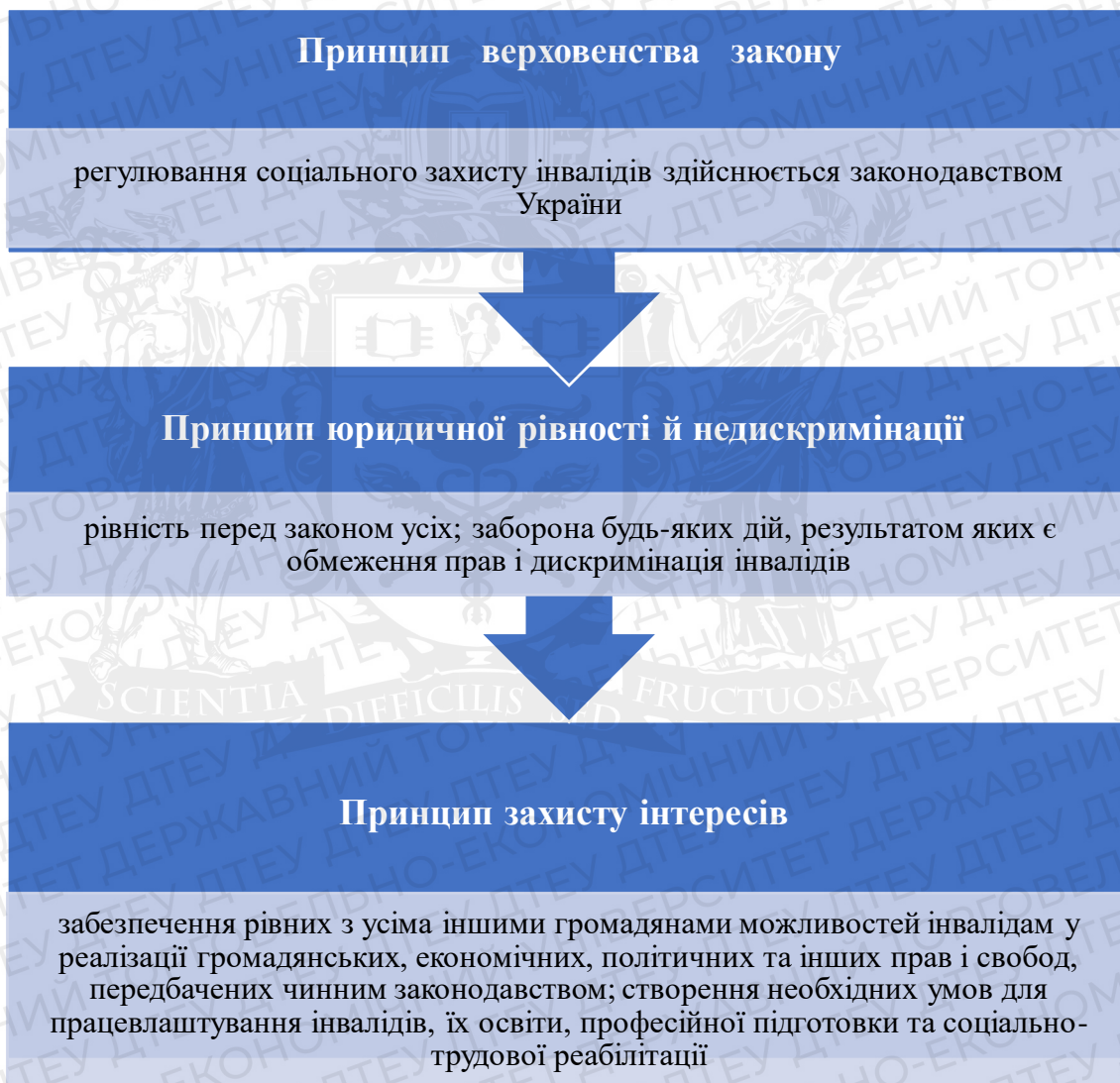
Рис. 1.1. Принципи державної політики щодо соціального захисту осіб з інвалідністю

Далі розглянемо основні принципи політики держави щодо соціального захисту осіб з інвалідністю зображені на рис. 1.1.