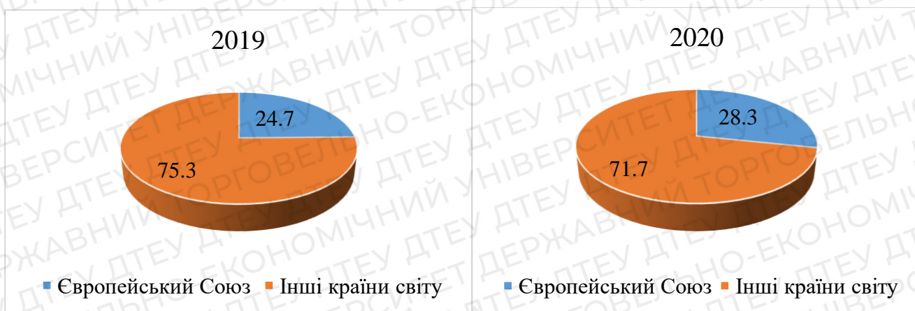
Рис. 1.3. Географічна структура ринків збуту ТОВ «Пирятинський сирзавод» за 2019-2020 рр., %

Джерело: побудовано автором за даними підприємства