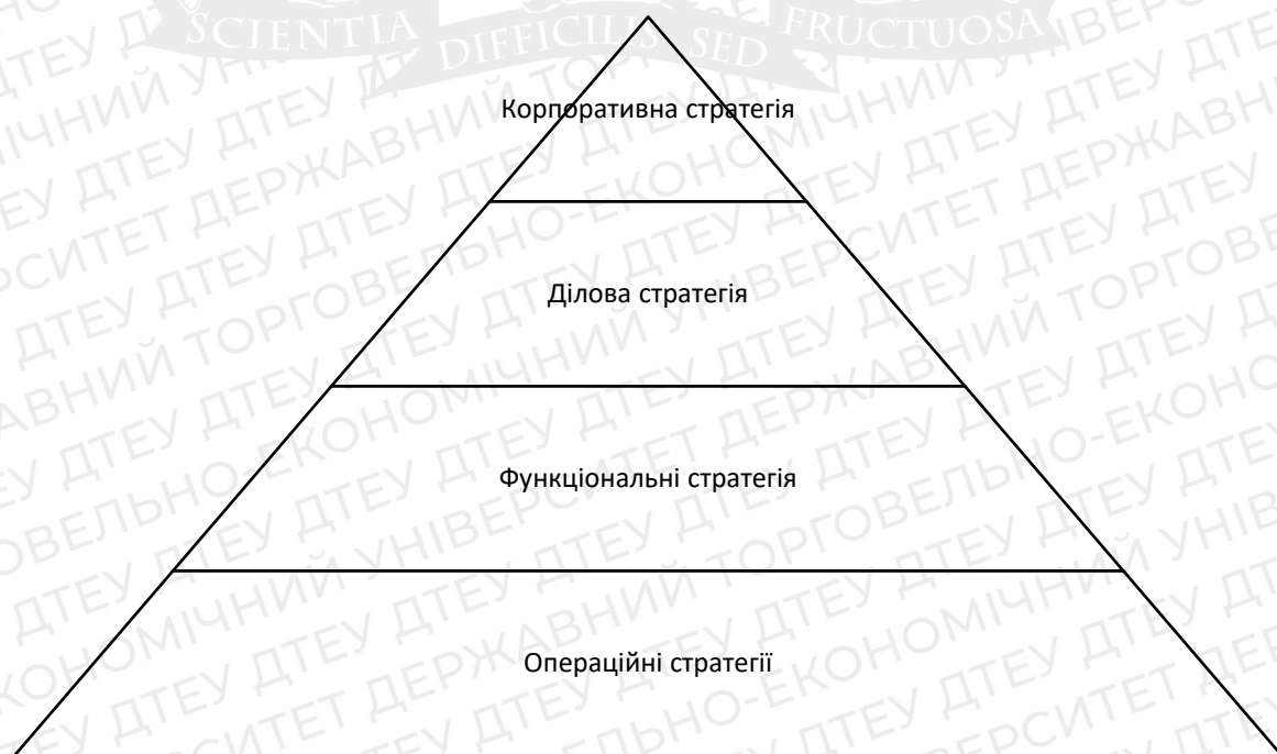
Рис.1.1 – «Піраміда стратегій» за Томпсоном А.А та Стріклендом

Томпсон А.А. та і Стрікленд також відносять фінансову стратегію до функціональних стратегій, а також вони розробили піраміду стратегій, що наглядно показує деяку ієрархію.