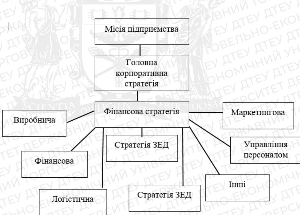
Рис. 2.1 – Структура стратегій підприємства.

Фінансова стратегія є фундаментом головної стратегії підприємства та, як головна сила у досягненні продуктивного використання власних ресурсів повинна забезпечувати стабільне покращення стану компанії. Пам'ятаємо, що фінансова стратегія входить до складу стратегічного напрямку всього росту підприємства, як видно на схемі.