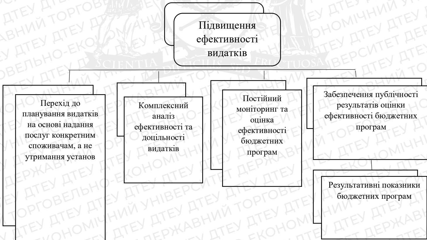
Рис. 1.4. Підвищення ефективності видатків