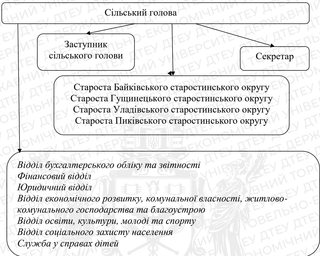
Рис.1.1. Структура апарату та виконавчих органів Іванівської сільської територіальної громади