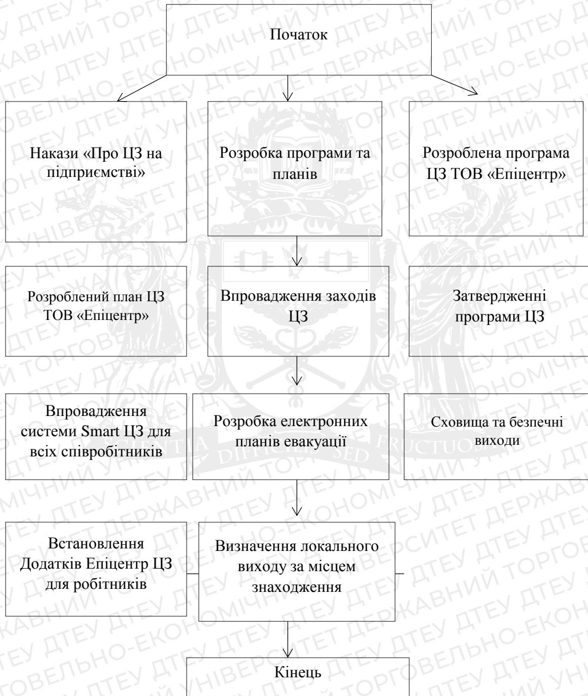
Рис.3.1. Регламентована процедура створення та підтримки в постійній готовності системи оповіщення про надзвичайну подію

Розробимо регламентовану процедуру створення та підтримки у постійній готовності системи оповіщення про надзвичайну ситуацію та подаємо її на рис.3.1.