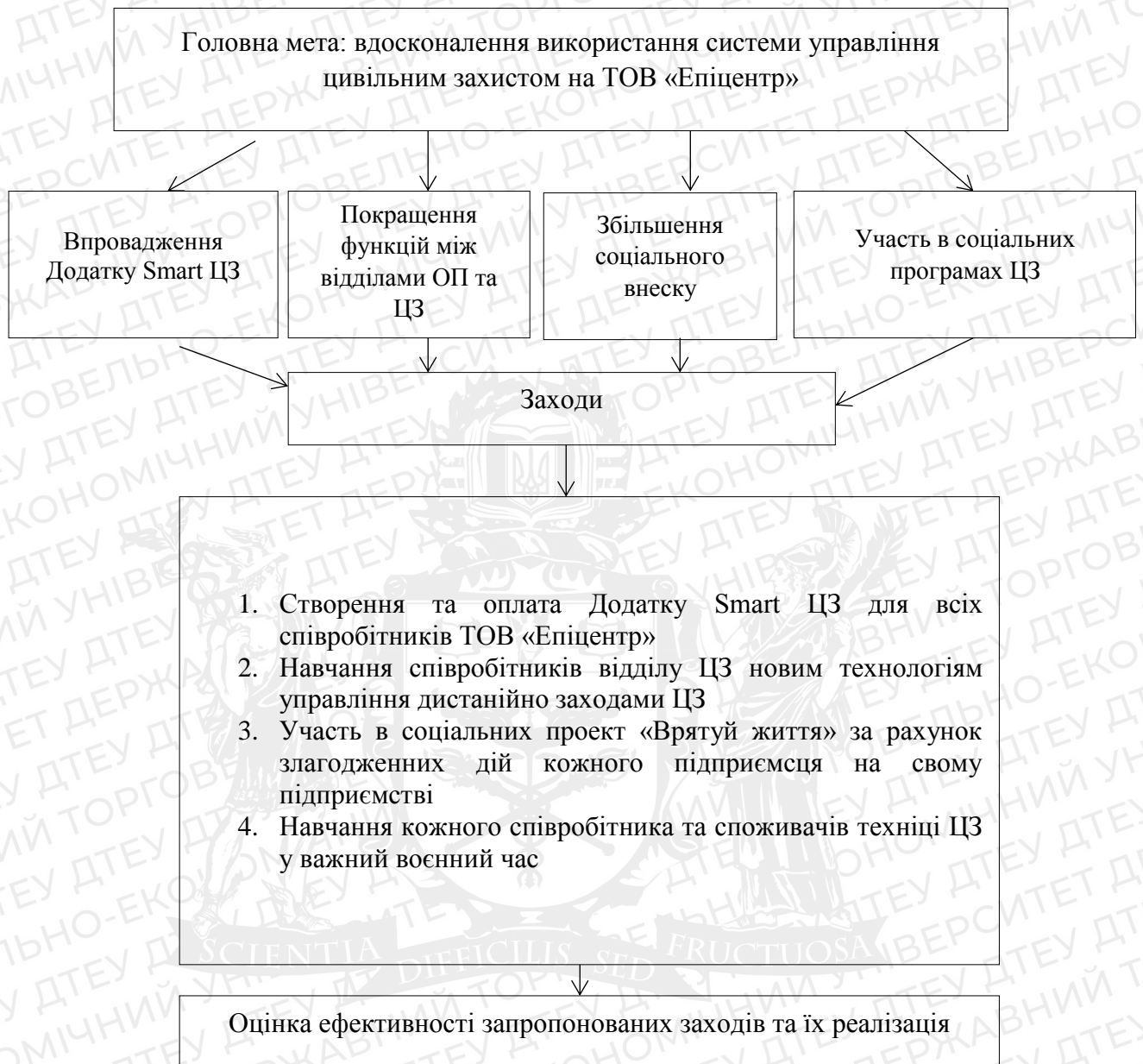
Рис.3.1. програмно-цільовий підхід до створення ефективної системи цивільного захисту на ТОВ «Епіцентр».