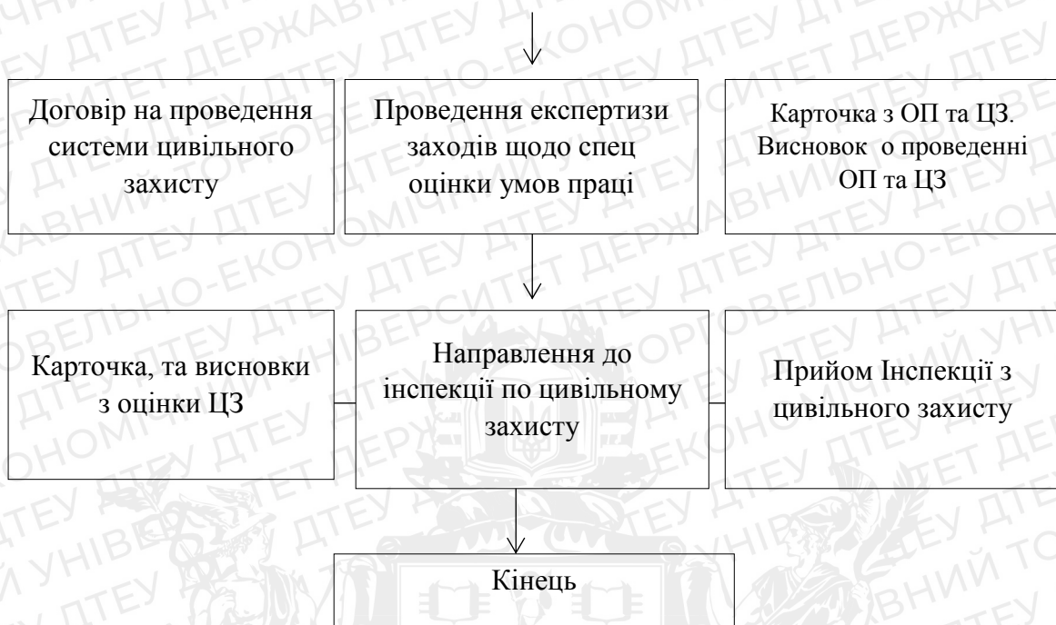
Рис.2.3. Блок-схема спеціальної оцінки умов праці та оцінка рівнів професійних ризиків

Джерело: складено на підставі даних підприємства