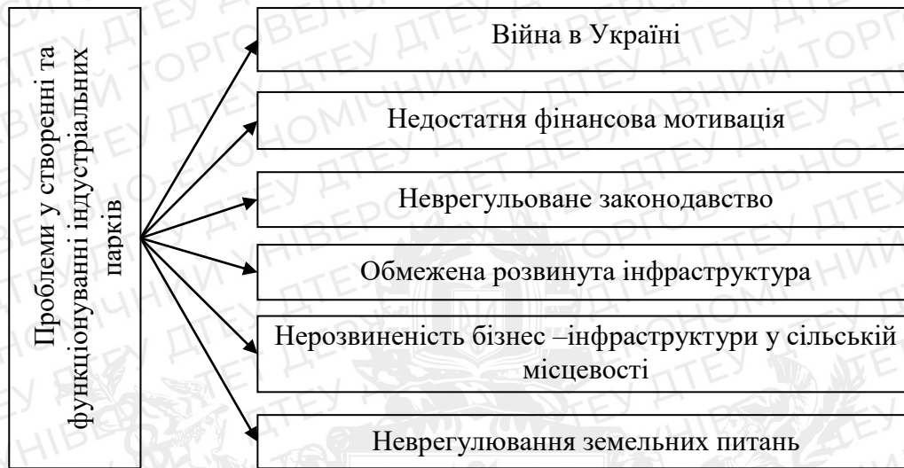
Рис.2.1. Проблеми у створенні та функціонуванні індустріальних парків в Україні