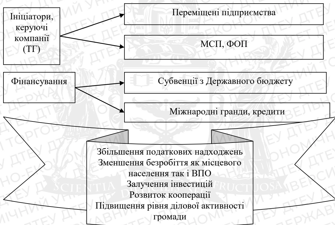
Рис. 2.3. Узагальнена модель створення індустріального парку в Україні

На рис. 2.3 наведено узагальнену модель створення індустріального парку в Україні.