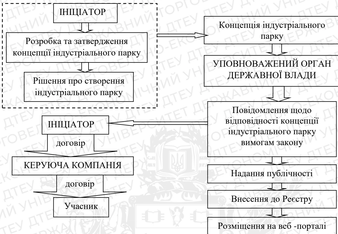
Рис. 2.2. Процедура створення індустриального парку