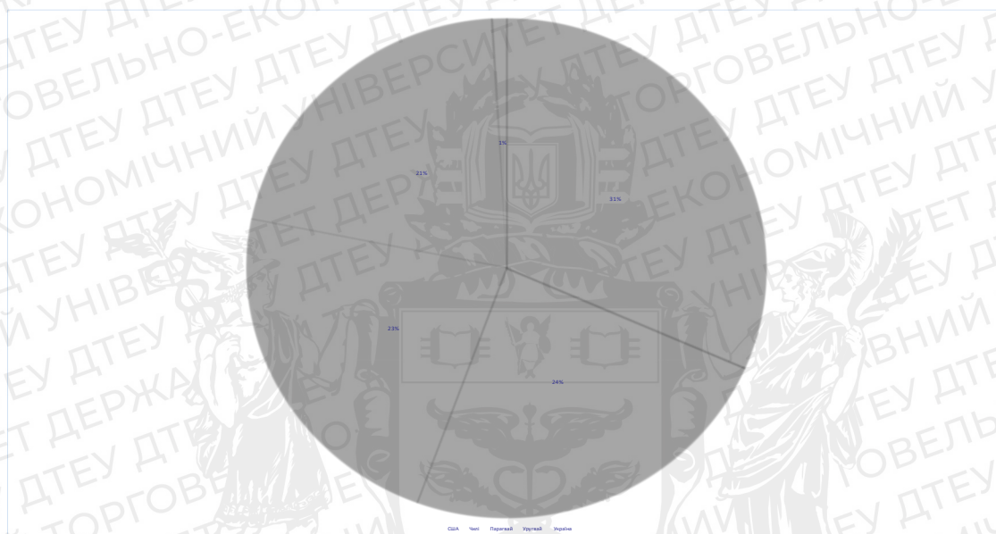
Рис. 2.1 Структура туристичних потоків в Бразилію в 2019 р.

туристів Бразилія не є масовим напрямком, але туристи прагнуть відвідати цю країну. Низький попит пов'язаний з високими цінами на переліт, тривалістю перельоту та високою вартістю турів. В основному дану країну обирають такі країни як США, Чилі, Парагвай, Уругвай - із-за ближчого розташування та доступнішою вартістю подорожі.