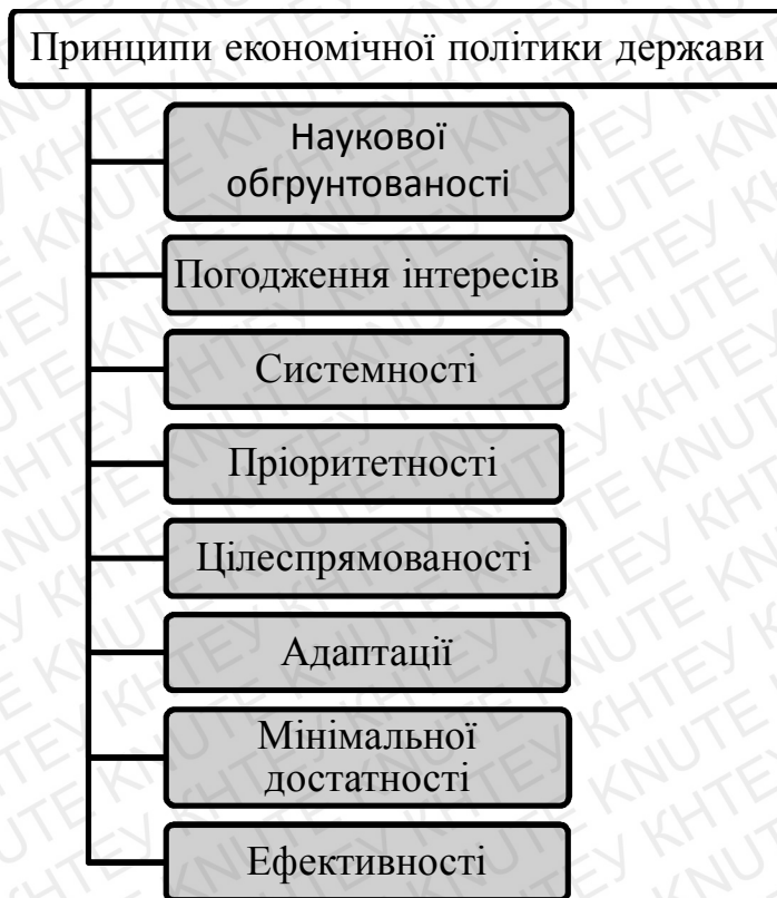
Рис. 2.1. Принципи економічної політики держави[5]

економічних законів, реалій економічного, політичного і соціального життя, національних особливостей. Економічна політика має бути механізмом погодження інтересів різних суб'єктів економіки - загальнодержавних, регіональних, групових (підприємців, робітників, споживачів, виробників тощо).