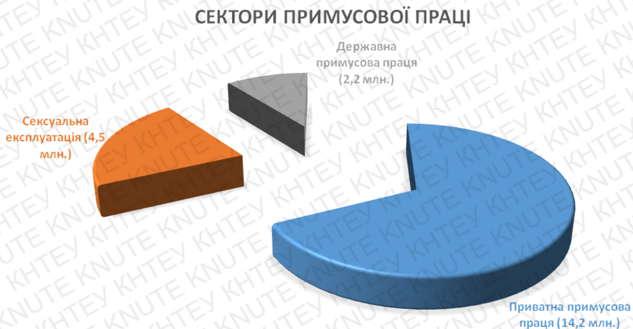
Рис. 1.1. Сучасні показники примусової праці

Торгівля людьми та сучасне рабство відбуваються в кожному куточку земної кулі. З огляду на прихований характер торгівлі людьми, практично неможливо зрозуміти повний обсяг і масштаб даної проблеми. Серед найбільш надійних джерел для розуміння глобальної ситуації є дослідження Міжнародної організації праці. Приблизні обсяги торгівлі людьми висвітлені у блозі американської громадянської організації «STOP THE TRAFFIK» (укр. Зупинимо торгівлю), які відобразили наступну статистику вказаного злочину на 2017 рік. Загальна кількість жертв досягає двадцяти одному мільйону громадян, які потрапляють в сучасне рабство. З них: