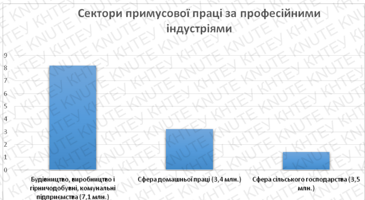
Рис 1.2. Показники примусової праці за професійними індустріями

Примусову працю розділяють за професійними індустріями та за різноманітним галузям промисловості [12]. Хоча кожна галузь є прискіпливою, що не дозволяє висвітлити точні показники, однак дані, які висвітлені у звіті, наведені наступним чином, з 14,2 мільйона жертв торгівлі людьми, які експлуатуються за примусовою працею.