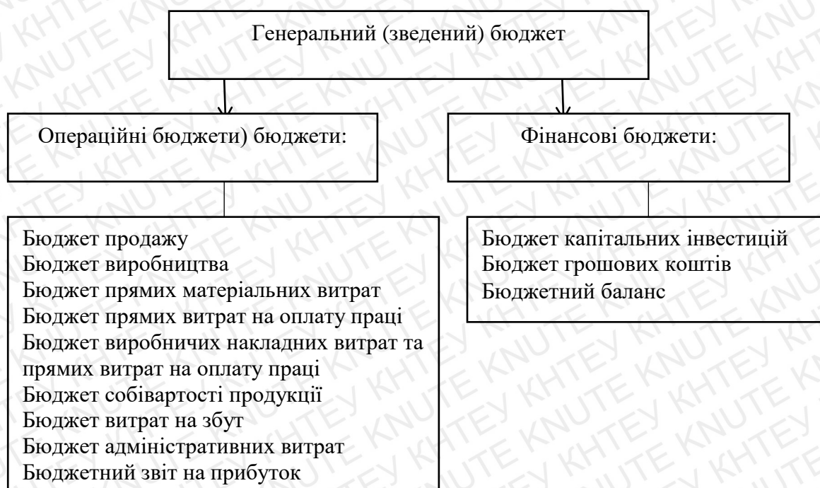
Рис. 1.1. Система бюджетів підприємства

Основним документом, який формується в процесі бюджетування, є загальний (зведений) бюджет компанії, який базується на різних бюджетах компанії. Зведений бюджет базується на операційних та фінансових планах (рис. 1.1).