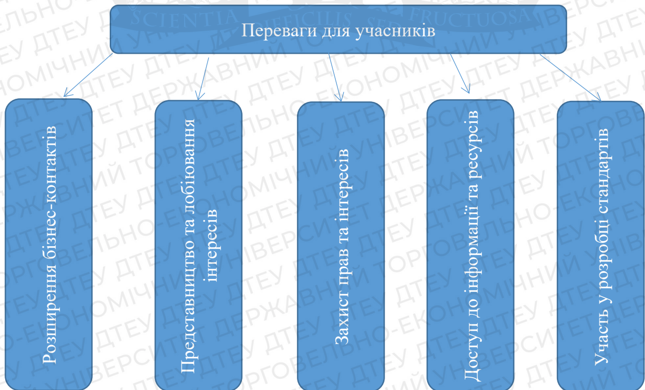
Рис.1.1. Переваги для учасників [11]

рішення є доказом того, що ICC Ukraine заслужила визнання та що її роль у захисті інтересів бізнесу та заохоченні економічного зростання України є важливою. Як єдина організація з таким статусом, ICC Ukraine має шанс активно впливати на світовий економічний розвиток і співпрацювати з партнерами з різних країн світу [29]. Організація є високоповажною асоціацією, яка бере участь у глобальній співпраці, і широко вважається надійним партнером для всіх учасників глобального бізнесу, уряду та світової спільноти. Його основна мета – сприяти зростанню міжнародної торгівлі та інвестицій шляхом впровадження найефективніших світових практик. МТР активно підтримує бізнес-спільноту, надаючи їм необхідні ресурси для успішного розширення своєї діяльності по всьому світу. Завдяки реалізації інноваційних стратегій МТР прагне досягти сталого розвитку міжнародної торгівлі та створити сприятливе середовище для прибуткових інвестиційних можливостей. Основною метою організації є зміцнення альянсів між підприємствами, державними установами та світовою спільнотою для досягнення сталого економічного зростання та процвітання [41]. Переваги для учасників представлені на рис 1.1.