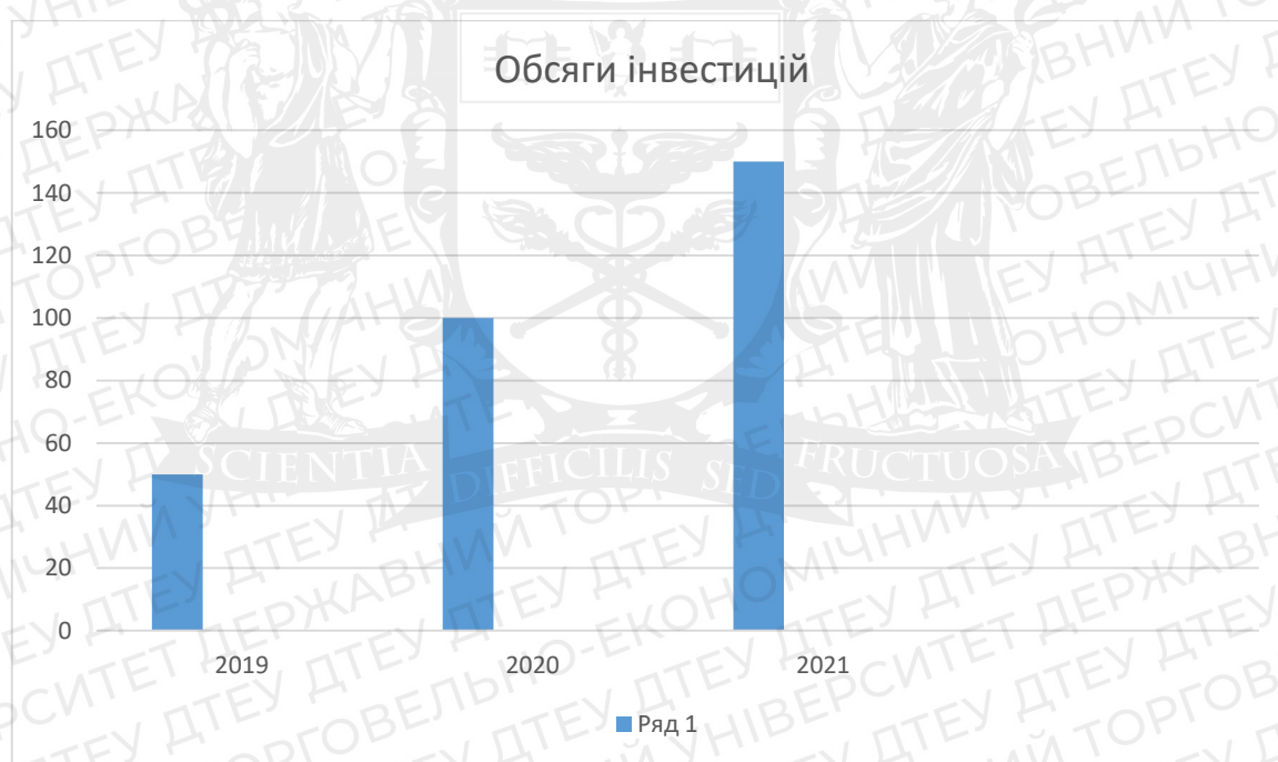
Рис.1.1 Обсяги інвестицій Digital Ukraine в Україну